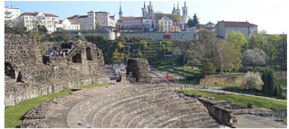
Le conte de 2 cités : Vienna et Lugdunum, villes sœurs