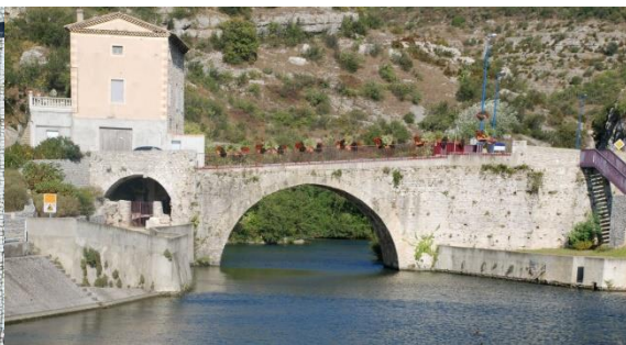
Pont romain, Le Pouzin