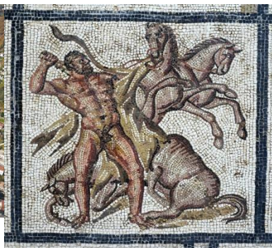
Musée de Valence