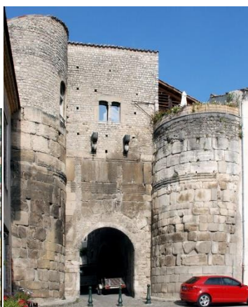
Porte Saint Marcel